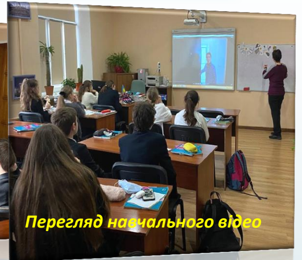
Перегляд навчального відео