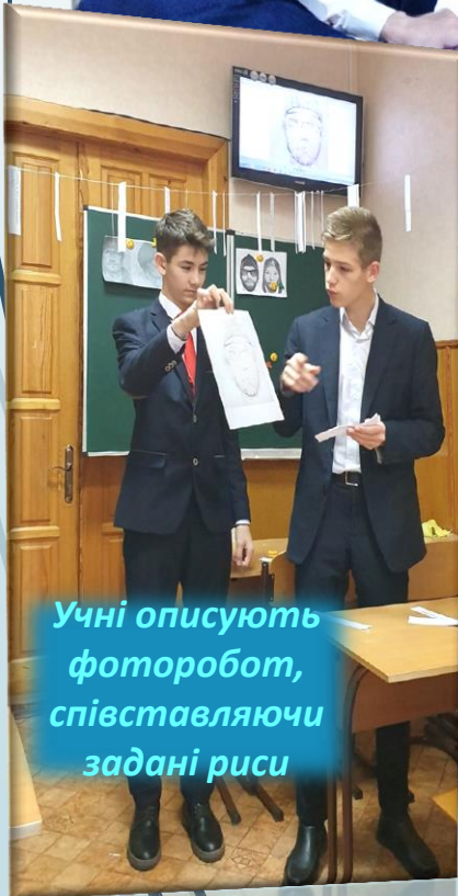
Учні описують фоторобот, співставляючи задані риси