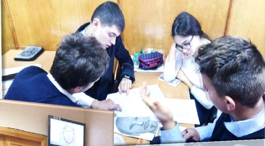
Група учнів вирішує фінальну задачу уроку