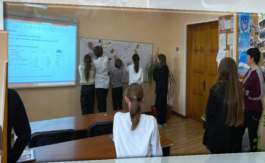
Робота в групах: вирішення завдання