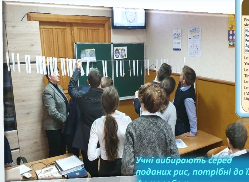
Учні вибирають серед поданих рис, потрібні до їх фотороботу